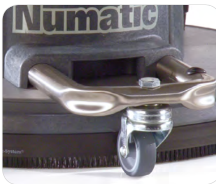
Führungsräder für äußerste Laufruhe