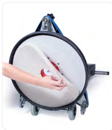
Padwechsel bei der HNS1550