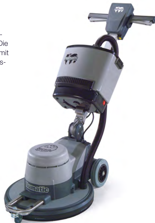
Abbildung mit optionalem Sonderzubehör