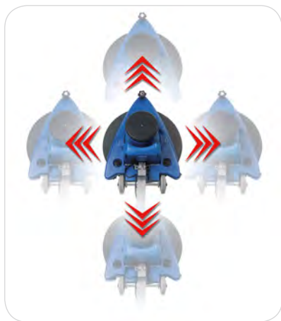
Drei Führungsräder sorgen für hervorragende Beweglichkeit