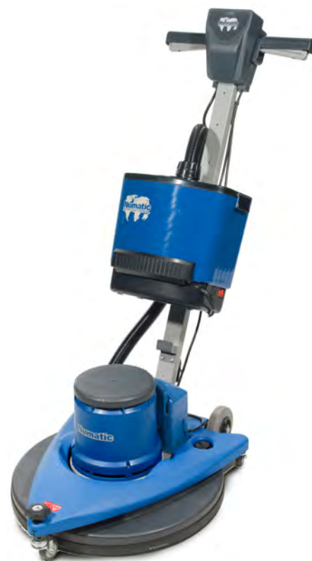
Abbildung mit optionalem Sonderzubehör